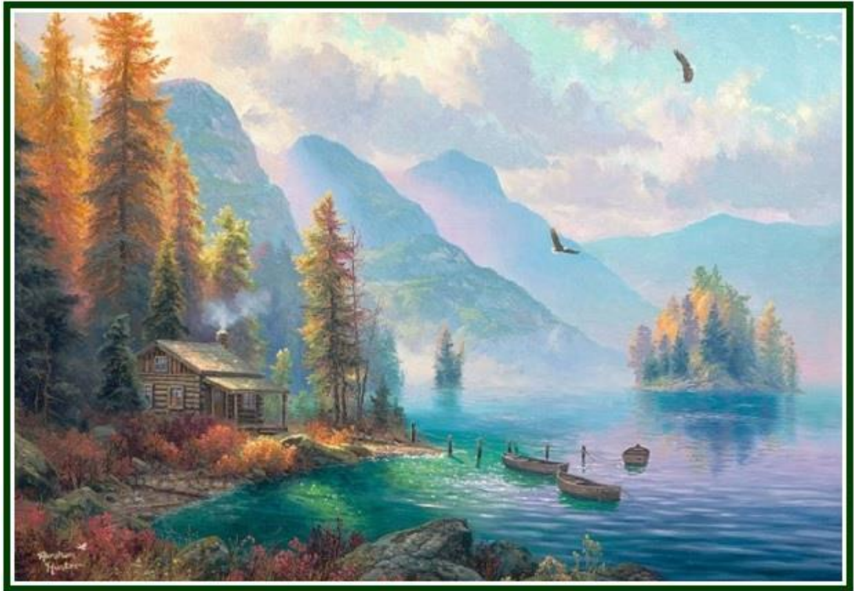
Vista parcial de una pintura de Abraham Hunter

Cuando tu mente instintiva esté en desarmonía con tus mejores intenciones, oponte a ella.